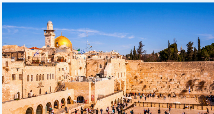
耶路撒冷老城（哭牆）