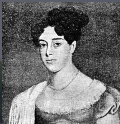
艾迪綏 Mary Ann Aldersey

通過實地走訪，了解百多年前一批又一批宣教士甘願放下家人和舒適的生活，千里迢迢來到相對落後的中華大地，他們一邊傳教，一邊將西方先進的科學文化、教育醫學帶入中國。他們「甘捨己，盡心愛」，活出一個個有血有肉的歷史見證，鼓勵今天的信徒承傳「信望愛」的生命。