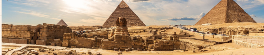
吉薩金字塔群、獅身人面像

古代七大奇蹟中之二：「金字塔」和「亞歷山大燈塔」，建築宏偉，令人嘆為觀止。今程參觀七個「世遺」，令人眼界大開。