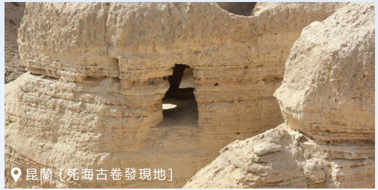
昆蘭 [死海古卷發現地]